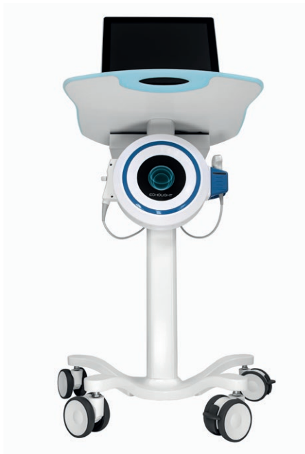
EchoS con carrello e laptop